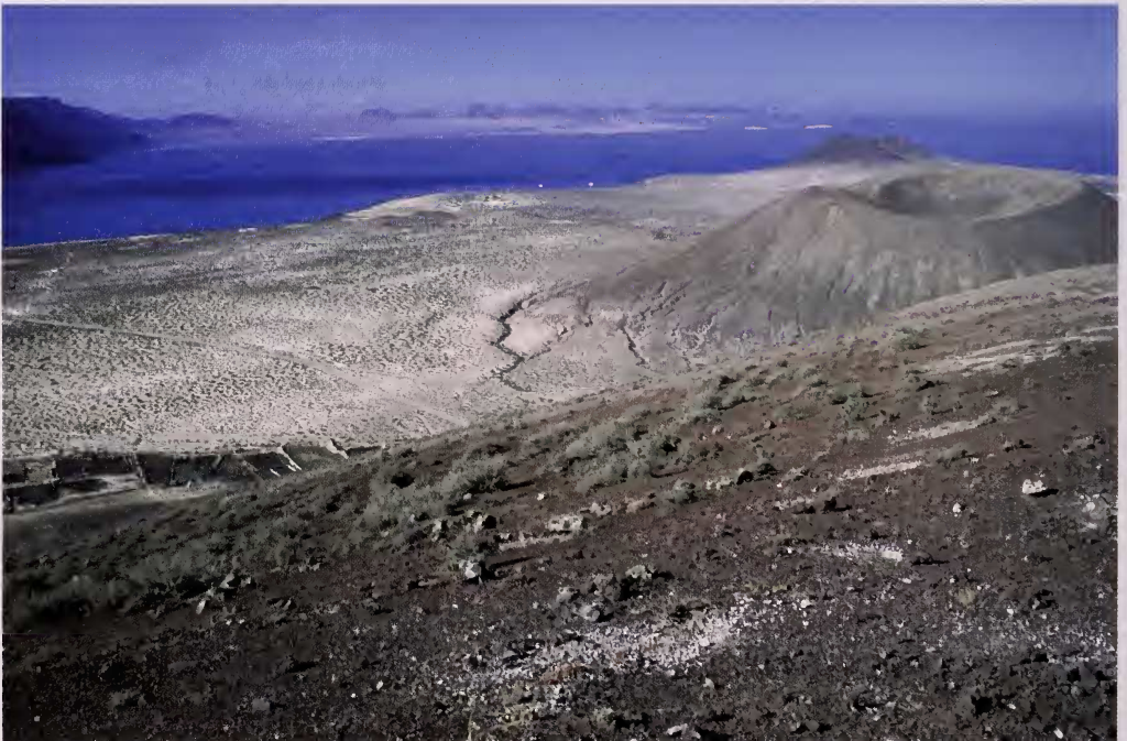
Foto 2.- Vista del extremo sur de La Graciosa desde lo alto de la montaña de Las Agujas. Se observa el cráter de la montaña del Mojón, y al fondo la cima de Montaña Amarilla y la zona de Famara en Lanzarote.